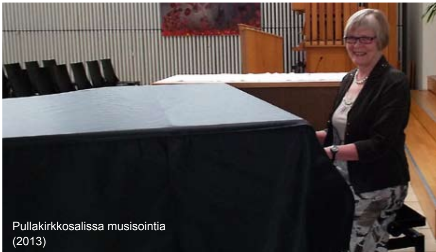
Pullakirkkosalissa musisointia (2013)

Viereinen sivu: Kaarina 7 km Naisten Kymppillä (2008)