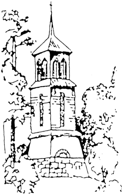
Kuva 2. Piirros kirkon tapulista

itselleen sen omistaneelta osakeyhtiöltä.