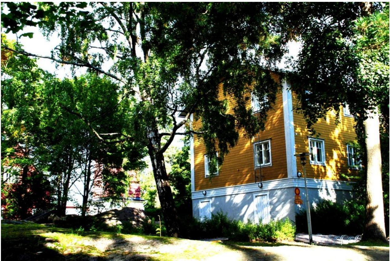
Kuva 5. Kirkonmäki ja nuorisotalo