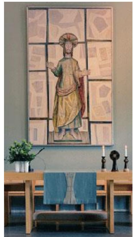
Kuva 3. Uusi alttaritaulu